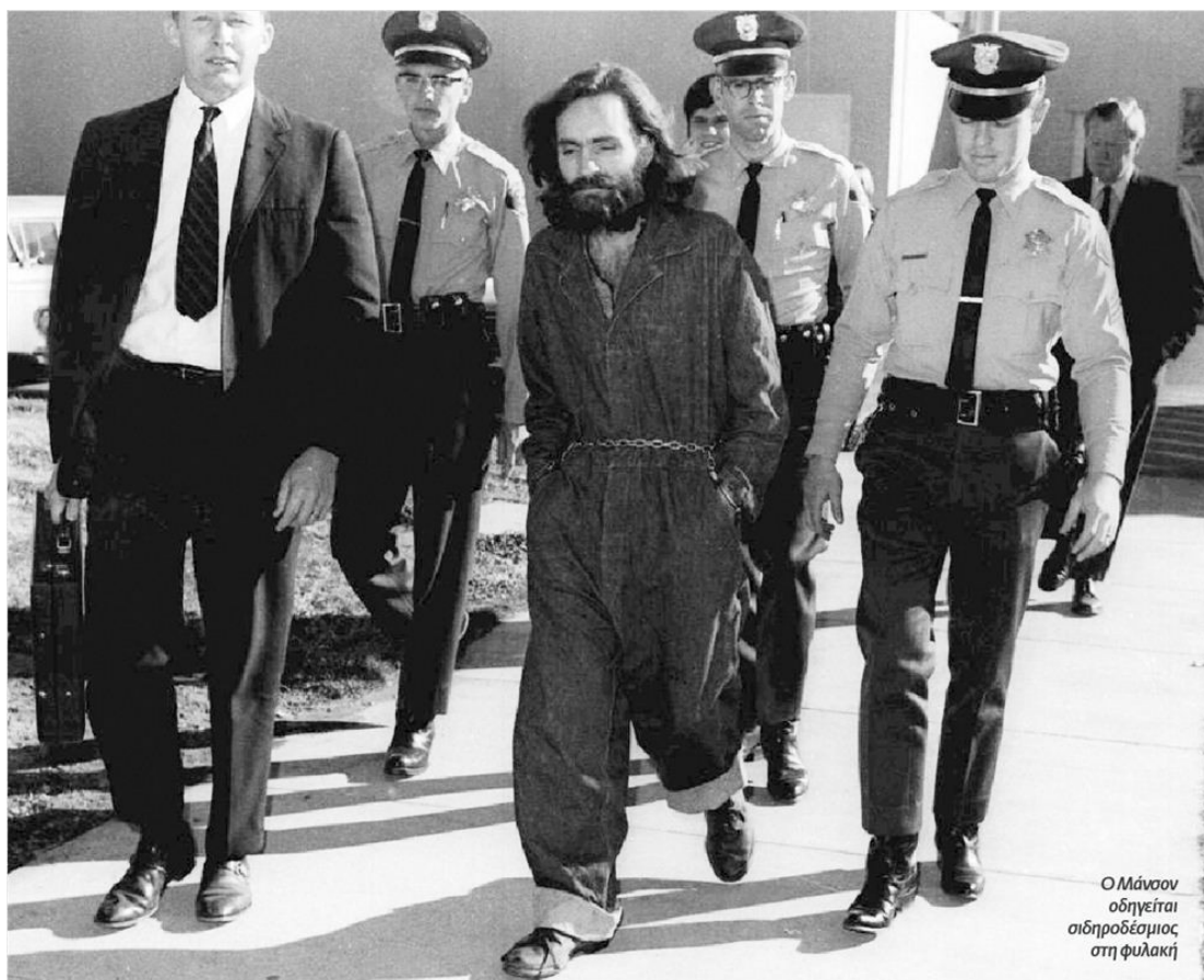
Ο Μάνσον οδηγείται σιδηροδέσιμος στη φυλακή

Το πορτοφόλι του Λένο ΛεΜπιάνκα δεν εμφανίστηκε ποτέ και το άλλοθι, ούτως ή άλλως εκκεντρικό, της εξέγερσης των μαύρων έμεινε χωρίς αποτέλεσμα. Ο Ρομάν Πολάνσκι, ο Πίτερ Σέλερς, ο Γιουλ Μπρίνερ και ο Γουόρεν Μπίτι προσέφεραν μια αμοιβή 25.000 δολαρίων για οποιαδήποτε έγκυρη πληροφορία θα οδηγούσε «στη σύλληψη του δολοφόνου της Σάρον Τέιτ, του αγέννητου παιδιού της και των υπόλοιπων θυμάτων». Η αστυνομία άργησε τρεις μήνες να ανακαλύψει κάποιο ίχνος που θα την οδηγούσε στην «Οικογένεια» και τα κατάφερε από ένα και μόνο αποτύπωμα που από απροσεξία άφησε η Σούζαν Ατκινς στο κούφωμα μιας