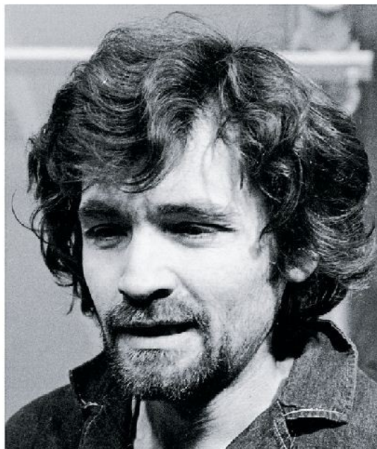
Ο Charles Manson όπως είναι σήμερα στις φυλακές όπου κρατείται, δεξιά τη χρονιά της σύλληψής του

Τον Αύγουστο του 1969 μια σειρά δολοφονίες συγκλόνισαν το Λος Αντζελες. Στις 9 Αυγούστου 1969, η σύζυγος του Ρομάν Πολάνσκι, ηθοποιός Σάρων Τέιτ, δολοφονείται βίαια στο σπίτι της, ενώ βρίσκεται στον όγδοο μήνα της εγκυμοσύνης της, μαζί με τέσσερις φίλους της. Την επομένη ο διευθυντής σουπερμάρκετ Λένο ΛεΜπιάνκα και η γυναίκα του δολοφονούνται με παρόμοιο, άγριο, τρόπο. Χρειάστηκαν τρεις μήνες για να καταλήξουν οι έρευνες στον Τσαρλς Μάνσον και στην αποκαλούμενη «Οικογένειά» του. Ο «απόλυτος κακός» πέρασε τα μισά χρόνια της νιότης του πίσω από τα κάγκελα της φυλακής για ληστείες και βιασμούς αλλά είχε υψηλότερες βλέψεις. Ήθελε να γίνει ο τελευταίος ηγέτης μιας ανθρωπότητας για την οποία προέβλεπε το ολοκαύτωμα. «Ας διαπράξουμε ένα έγκλημα που θα τραβήξει την προσοχή του κόσμου» είπε στους ακολούθους του στο παραλήρημά του. Και το κατάφεραν