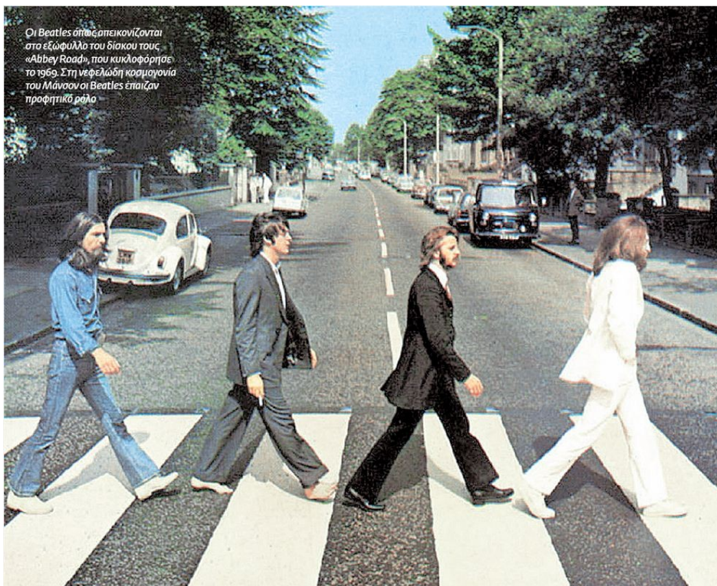
Οι Beatles όπως απεικονίζονται στο εξώφυλλο του δίσκου τους «Abbey Road», που κυκλοφόρησε το 1969. Στη νεφελώδη κοσμογονία του Μάνσον οι Beatles έπαιζαν προφητικό ρόλο

Το πρώτο που έκανε μόλις αποφυλακίστηκε ήταν να πάρει το λεωφορείο για το Σαν Φρανσίσκο, την πόλη στην οποία επί 16 χρόνια προσπαθούσε να πάει. Εκεί, με πρόσχημα την κιθάρα του, μπήκε σε ένα κοινόβιο και μέσα σε λίγες ημέρες, με τα τραγούδια του και τους λόγους του περί σαϊεντολογίας, διανθισμένους με βουδισμό και αυτοβοήθεια, έγινε αρχηγός μιας ομάδας χίπηδωντης συμφοράς που άκουγαν με αφοσίωση τον μεσσιανικό του λόγο και έπαιρναν, τυφλωμένοι από την πίστη, τις δόσεις LSD που μοίραζε ο Μάνσον στη φυλή του με